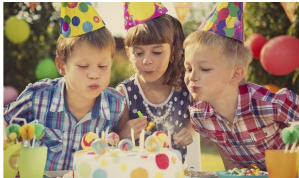
Festa de Aniversário