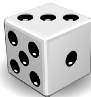
Cubo - tridimensional